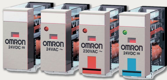
Реле, Область применения